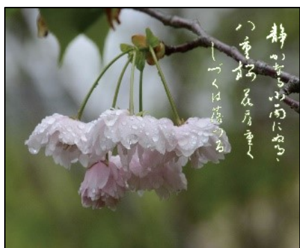
静かなる小雨にぬるハ重桜 花房重くしづくは落つる