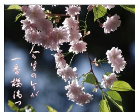
今生の今が一番櫻満つ