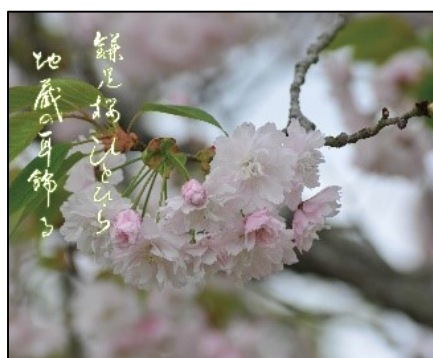
鎌足桜ひとひら地蔵の耳飾る