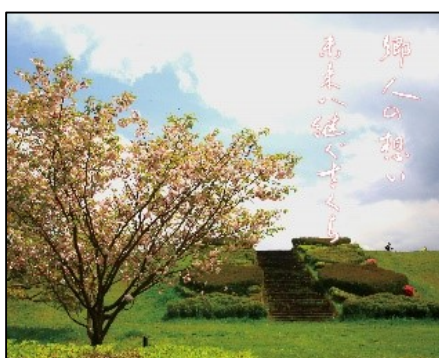
郷人の想い未来へ継ぐさら