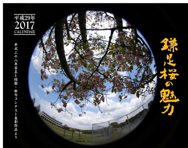
平成29年版カレンダー「鎌足桜の魅力」表紙