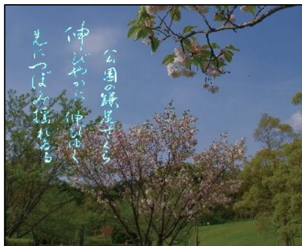
公園の鎌足さら伸びやかに 伸びゆく先につぼみ揺れある