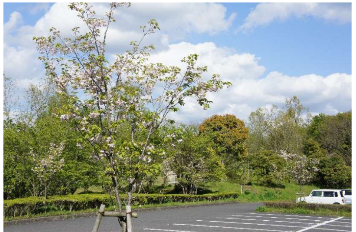
ダム公園第2駐車場